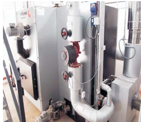
Biomasseanlage zur Wärmebereitstellung

Aber auch den Schülern, Vorschulkindern und den städtischen Mitarbeiter als Nutzern der kommunalen Liegenschaften werden regelmäßig die Aktivitäten erläutert und wichtige Informationen zum effizienten Energieeinsatz weitergegeben. Dabei wird auch auf die Eigeninitiative gesetzt und so eine hohe Akzeptanz und Identifizierung mit der Maßnahme erreicht.